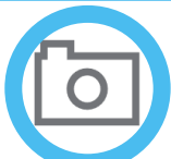
Photo OK ! 可以拍照