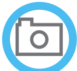
Photo OK ! 撮影OK !