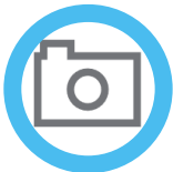
Photo OK !