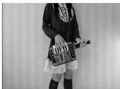
無限音階スーフファミ