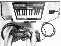
演奏できるPS3コントローラー