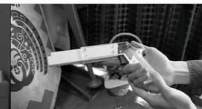
組み立て式ゴム銃