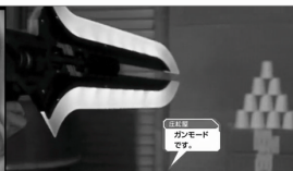
ヴィタスラッシュ