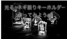
光るネギ振りキーホルダー