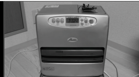
リモコン操作追加ヒーター